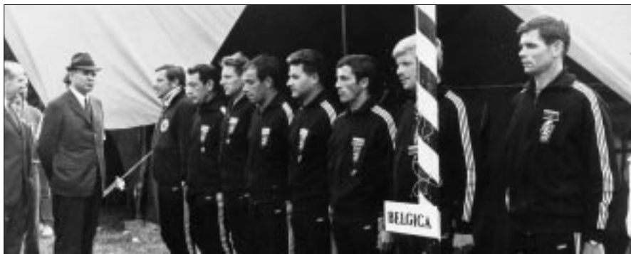
1971. 5ème championnats de parachutisme CISM à Sintra (Portugal).