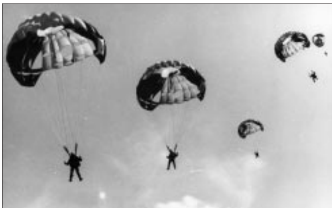
PA in ploeg van 5.