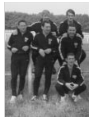
L'équipe belge aux Championnats d'Italie à Pise 1972.

Na deze tweede selectie werden dezelfde mededingers weerhouden om deel te nemen aan het 6e Burgerlijk Wereldkampioenschap dat in augustus 1962 doorging in de V.S.