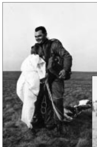
Ministre-Minister Ch.Poswick 1968.