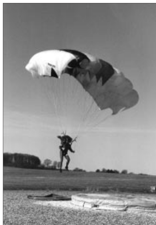
Para-Foil (North General Dynamics).

D'autres voilures « type aile » sont utilisées au CEPara pour chaque discipline.