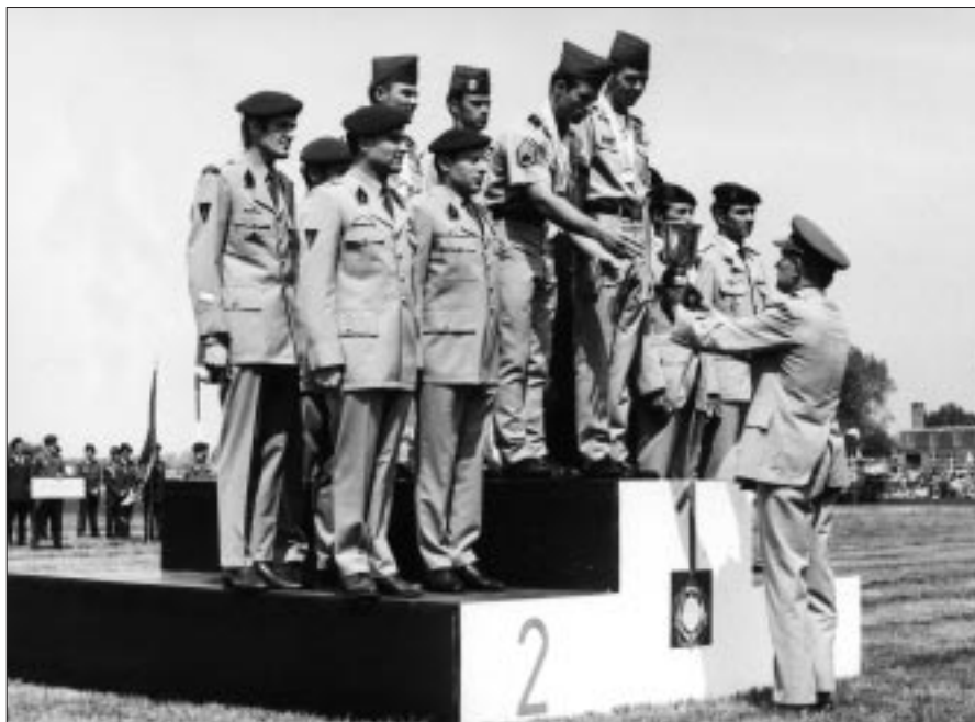
Championnat Parachutisme du CISM à Schaffen (mai 1973).

Kampioenschap CISM in Schaffen (mei 1973).