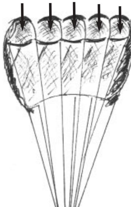
EFA-Strato-Star cinq caissons.

1970: “Olympic Papillon” (EFA), en “Papillon” (Pioneer). Deze twee types met porositeit-nul bieden dezelfde voordelen als de vorige maar geven meer horizontale snelheid. De “Papillon VS” zit opgeplooid in een klein harnas dat de bewegingen in de lucht gemakkelijker maakt en een betere prestatie qua landingsprecisie toelaten.