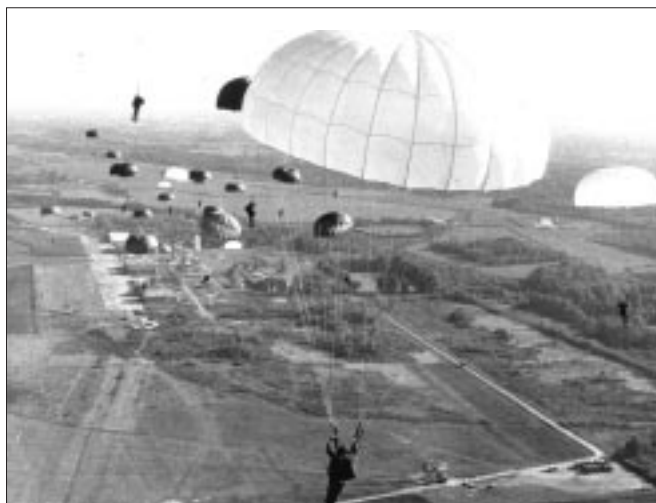
EFA 665 rond utilisé pour les sauts en automatique. De ronde EFA 665 voor de sprongen met automatische opening.

Z E ZIJN HALFBOLVORMIG met een oppervlakte van 40 tot 60 m 2 (training). De verticale daalsnelheid met een last van 80kg bedraagt zo'n 5m /sec. De opgevangen lucht ontsnapt doorheen de "schouw" in de top, wat, door reactie, het geheel een verticale stabiliteit geeft, en doorheen het weefsel waarvan de porositeit verschilt naargelang de modellen; soms worden, door de lucht, schommelingen ( swing ) veroorzaakt.