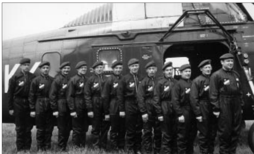
Première photo officielle des « Black Devils » : Eerste officiële foto van de « Black Devils »