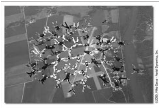
Record du monde dans les années '90 à Coxijde. Wereldrecord in de jaren '90 te Koksijde.