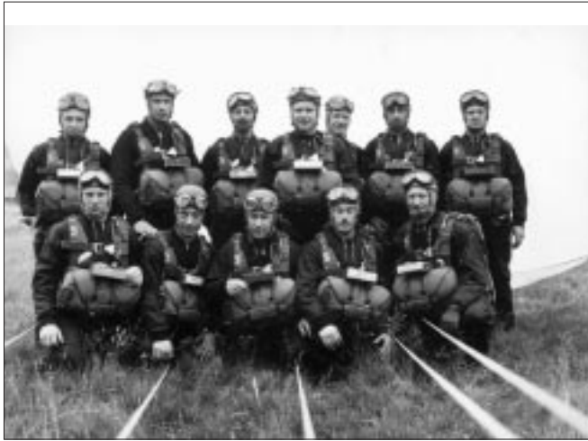
Autre photo des "Black Devils" 1967. Andere foto van de « Black Devils » 1967.