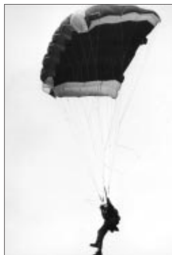
Strato-Cloud (North General Dynamics) 1977.