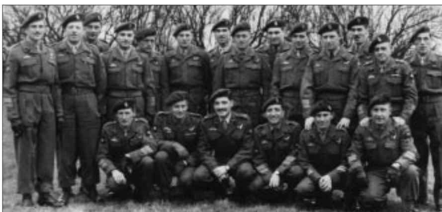
Les premiers Dispatchers brevetés OR.

De 10e december wordt opnieuw gesprongen, ditmaal uit C-119 op de DZ „Kerkhoven“, op een hoogte van 1.700 voet, met een parachute EFA 651, even-